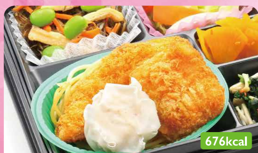
27 アジ味佃干しフライ キャベツ中華炒め/刻み昆布煮