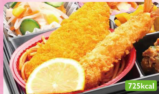
14 エビフライ&白身フライ /三色金平