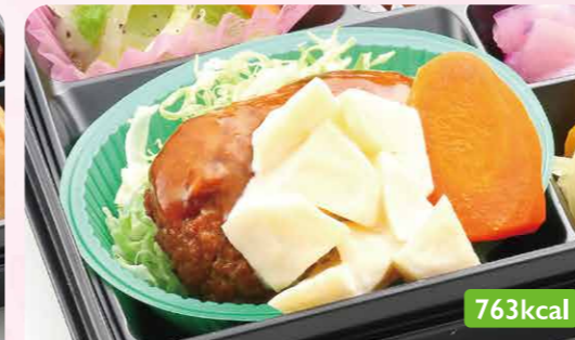
9 ポテサラハンバーグ カニクリームコロッケ/玉ねぎスープ煮