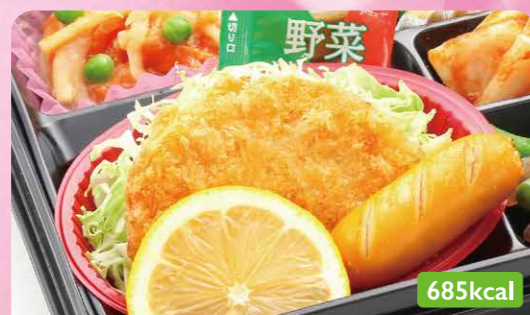
28 チキンカツ ブロッコリーサラダ/いんげん炒り煮