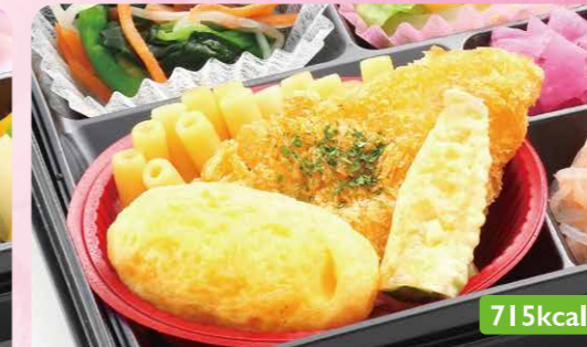
10 ササミフライ 菜の花お浸し/白滝真砂煮