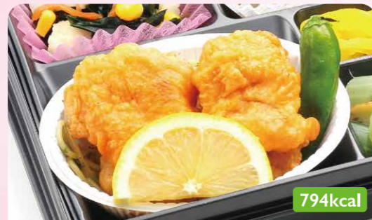
7 鶏唐揚げ サウザンサラダ/フキ炒め