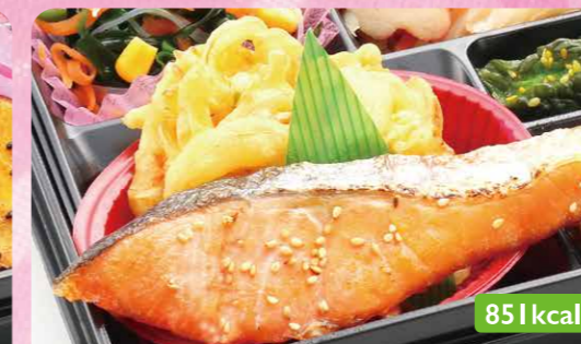
17 マス塩焼き 枝豆かき揚げ/春雨サラダ