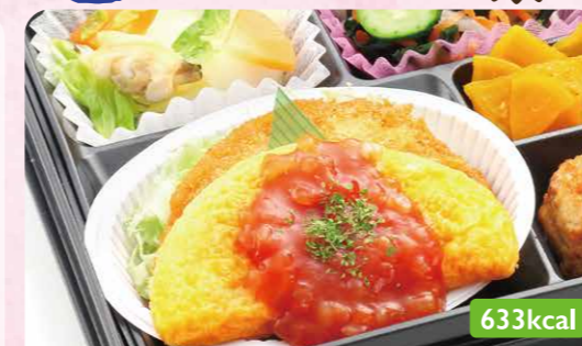
30 オムレツ トマトソース ハムサラダフライ/白菜洋風煮