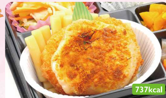
15 鶏肉スパイシー焼き 野菜コロッケ/小松菜バターソテー