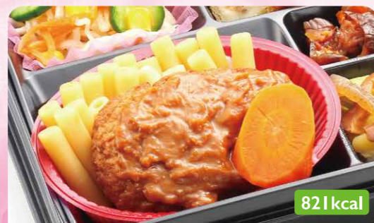
21 煮込みデミハンバーグ ミートクノーデル/大根サラダ