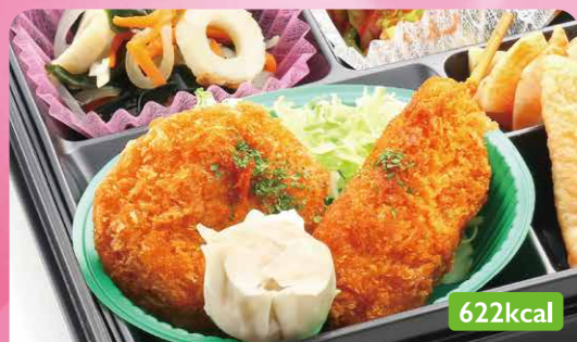
13 ヒレカツ 肉シュウマイ/わかめ酢の物