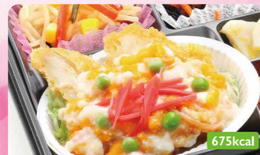
22 カツ丼風煮 ひじき煮/もやしオイスター炒め