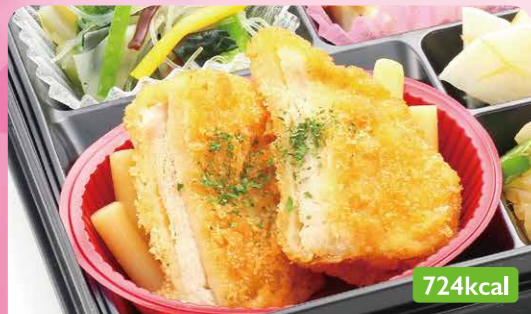
6 トンカツ オクラおかか和え/笹がきごぼう煮