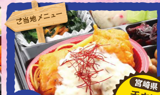
23 宮崎県 チキン 南蛮 タルタル