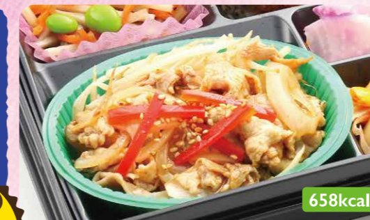
24 豚肉生姜炒め じゃが芋トマト煮/目玉焼きフライ