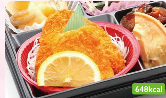
8 アジフライ&イカ寄せフライ /大根味噌煮