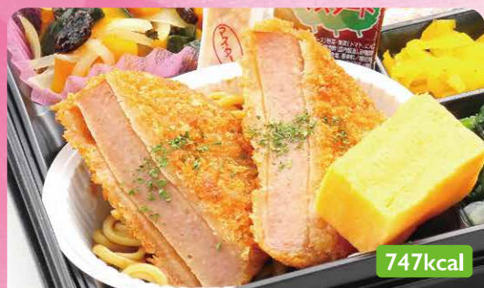
20 ハムカツ かぼちゃサラダ/竹の子土佐煮