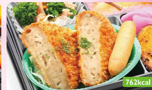
16 メンチカツ ツナサラダ/中華旨煮