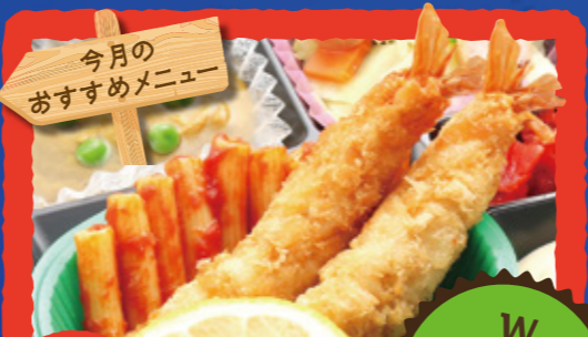
16 W エビフライ 弁当