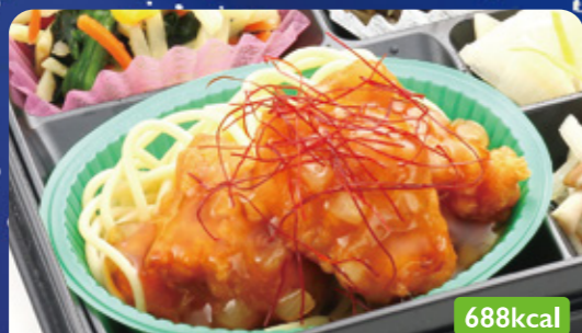
14 油淋鶏 竹の子塩金平/刻み昆布煮