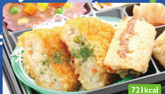
6 肉じゃがコロケツ ハヤシチュー/肉野菜巻き