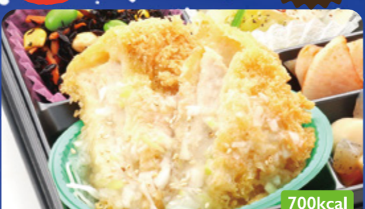
23 トンカツ ねぎ塩たれ 里芋煮/ひじきサラダ