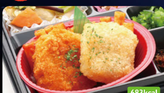
27 ぷりっとエビカツ &ヒレカツ/中華旨煮