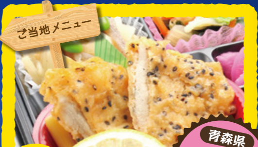
10 ハムカツ 小松菜ピリ辛炒め/もやし甘酢和え