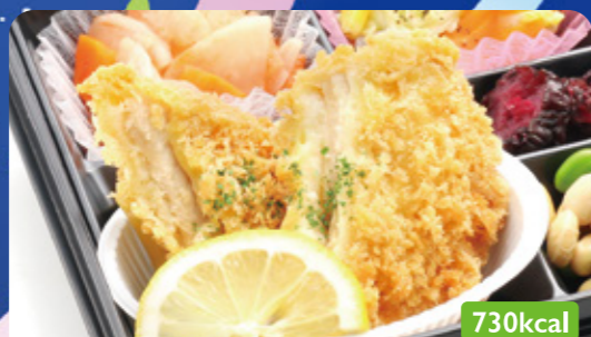
7 トンカツ 大根韓国風煮/ビーンズサラダ