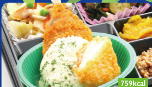
8 アジフライ &イカ寄せフライ/わかめ梅肉和え