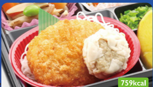
17 チキンカツ 肉シュウマイ/笹がきごぼう煮