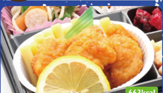
30 鶏唐揚げ キャベツ昆布和え/カリフラワートマト煮