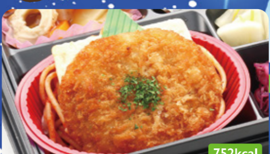
31 チーズメンチ じゃが芋甘辛煮/白菜韓国風炒め