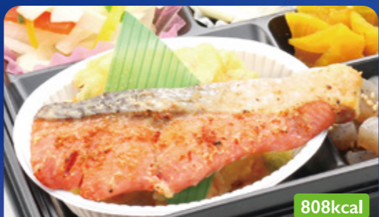
15 マス味噌焼き 枝豆かき揚げ/ピーマンソテー