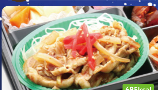
29 豚肉生姜炒め かぼちゃノーデル/ツナサラダ