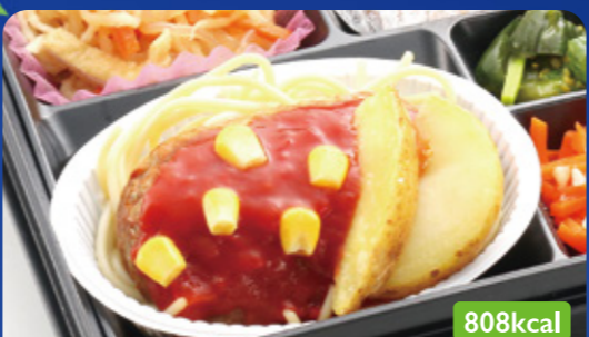
9 ハンバーグ トマトソース ハムクラッチカツ/人参ピーナッツ和え