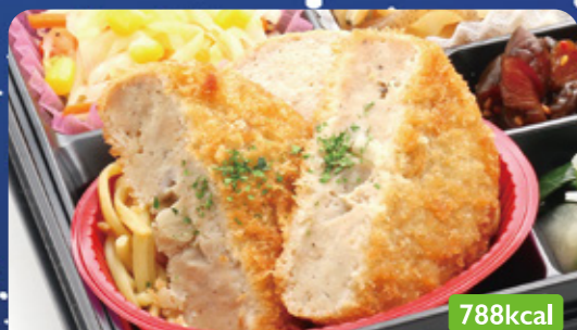
13 メンチカツ コールスローサラダ/ほうれん草ソテー