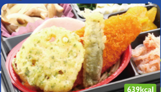
24 白身魚フライ フィッシュソーセージ/五目旨塩炒め