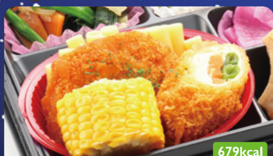
21 ハムサラダフライ& 野菜ロールフライ/チンゲン菜味噌炒め